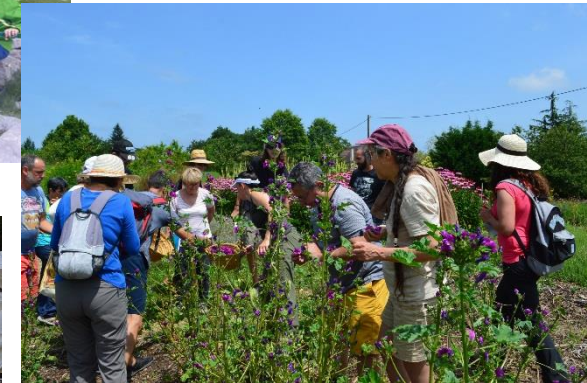
n°35 Paysan Herboriste