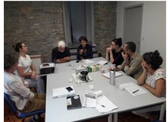
Groupe de travail Pôle Ressources