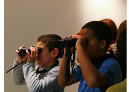
Découverte de la Biodiversité et des « 64 Fantastiques » Forum des acteurs-novembre 2019