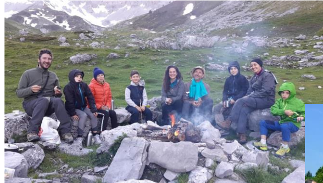
n°22 Mon premier Bivouac