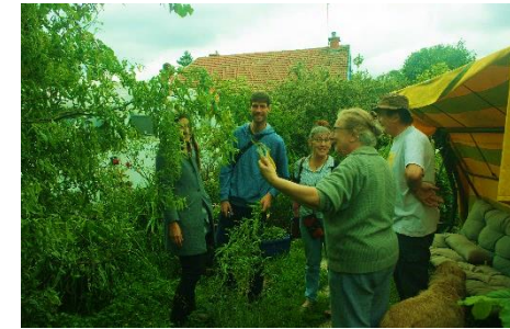
Bienvenue dans mon jardin au naturel 15 juin