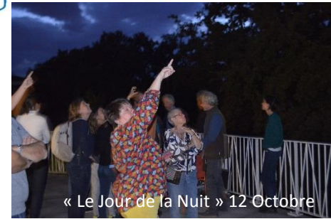
« Le Jour de la Nuit » 12 Octobre