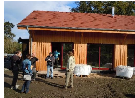
n°29 Visite d'une maison bois et paille