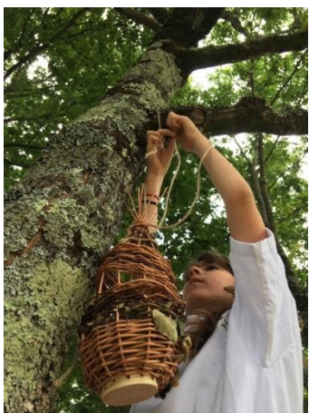
Ecole de Trianon – Pau Phase d'action