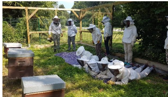
n°33 Les abeilles sociales et solitaires