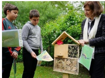
Inauguration Hôtel à insectes – CD64 Rencontre avec les élus – mai 2019