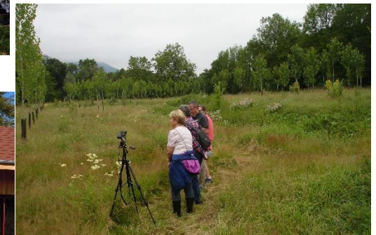
n°20 Curieuse Nature!